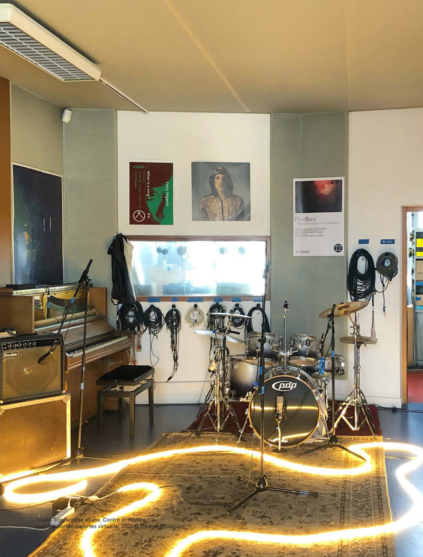
Studio Son, annexe ebabx, Contre la montre, journées portes ouvertes virtuelle, 2021