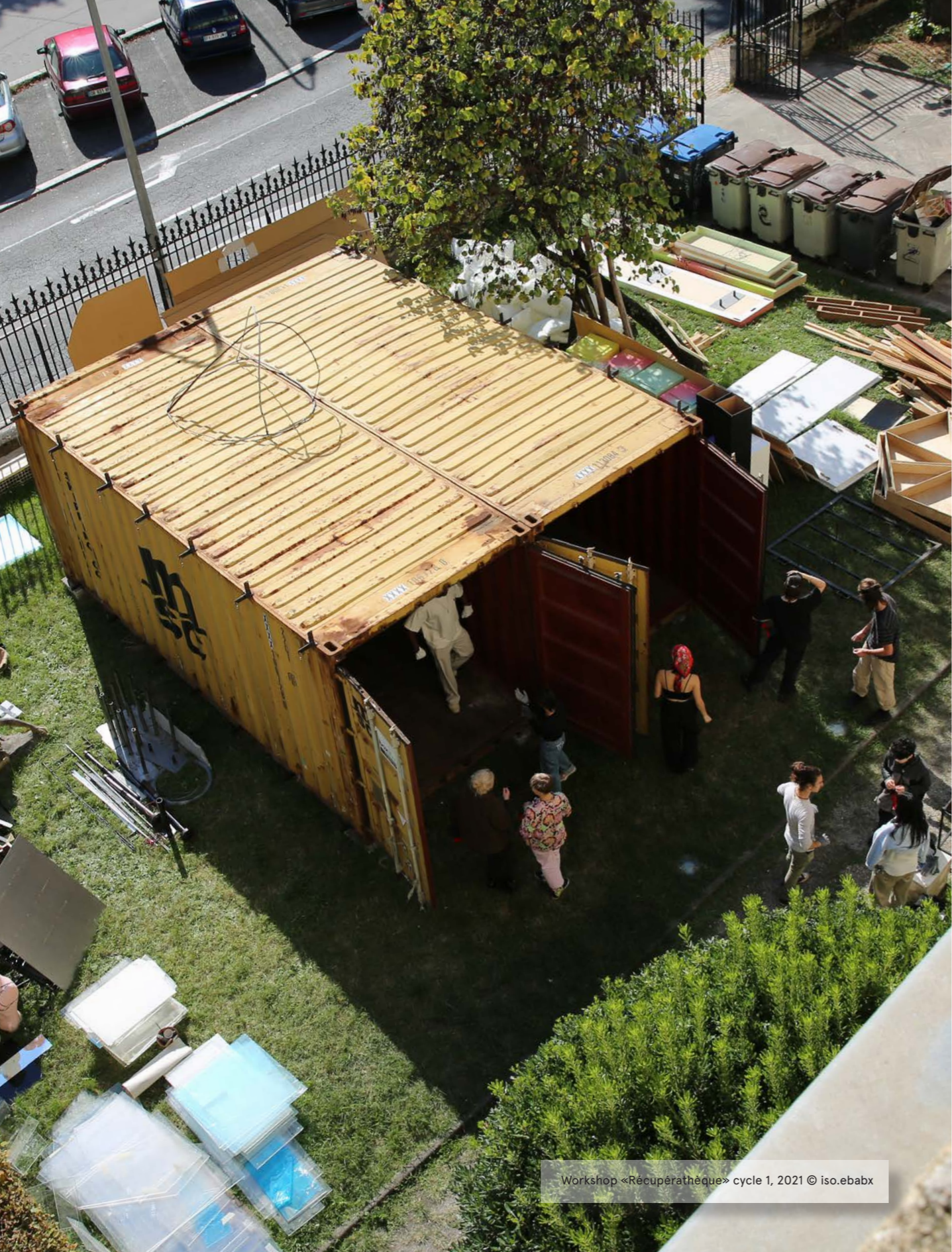
Workshop «Récupérathèque» cycle 1, 2021