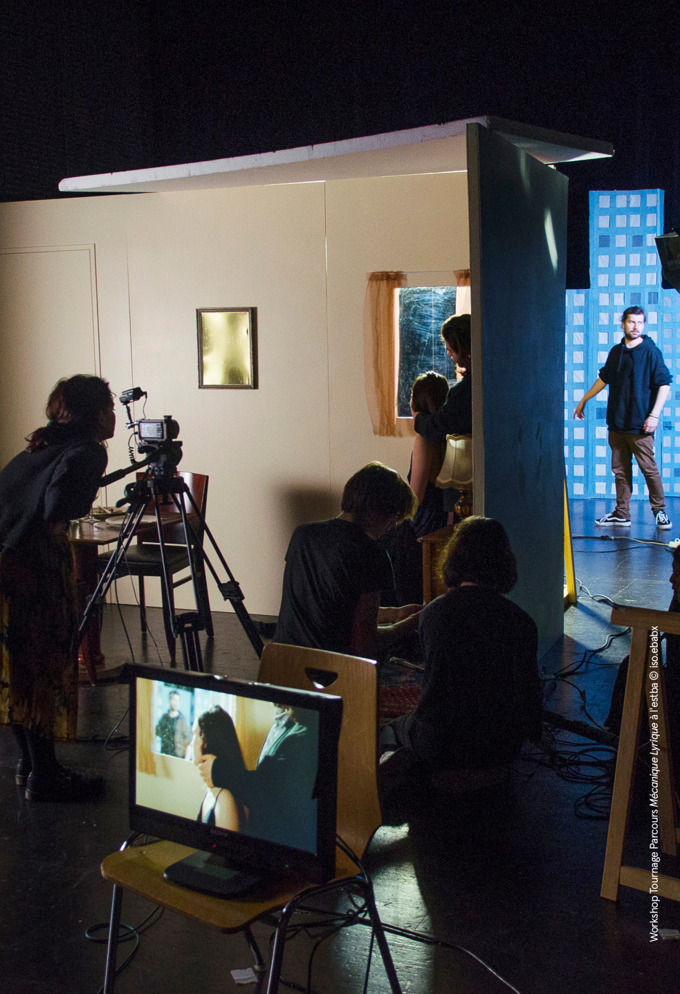
Workshop Tournage Parcours Mécanique Lyrique à Testba