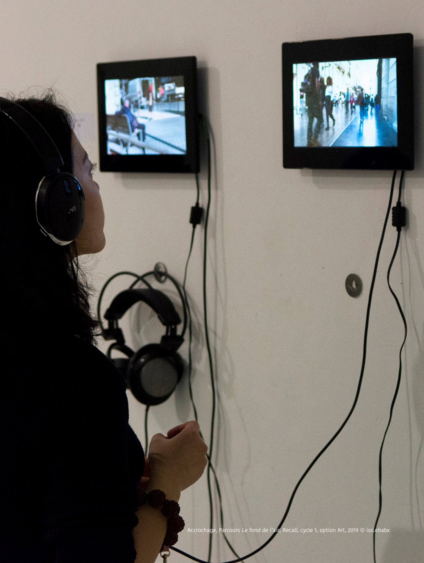
Accrochage, Parcours Le fond de l'air, Recall, cycle 1, option Art, 2019