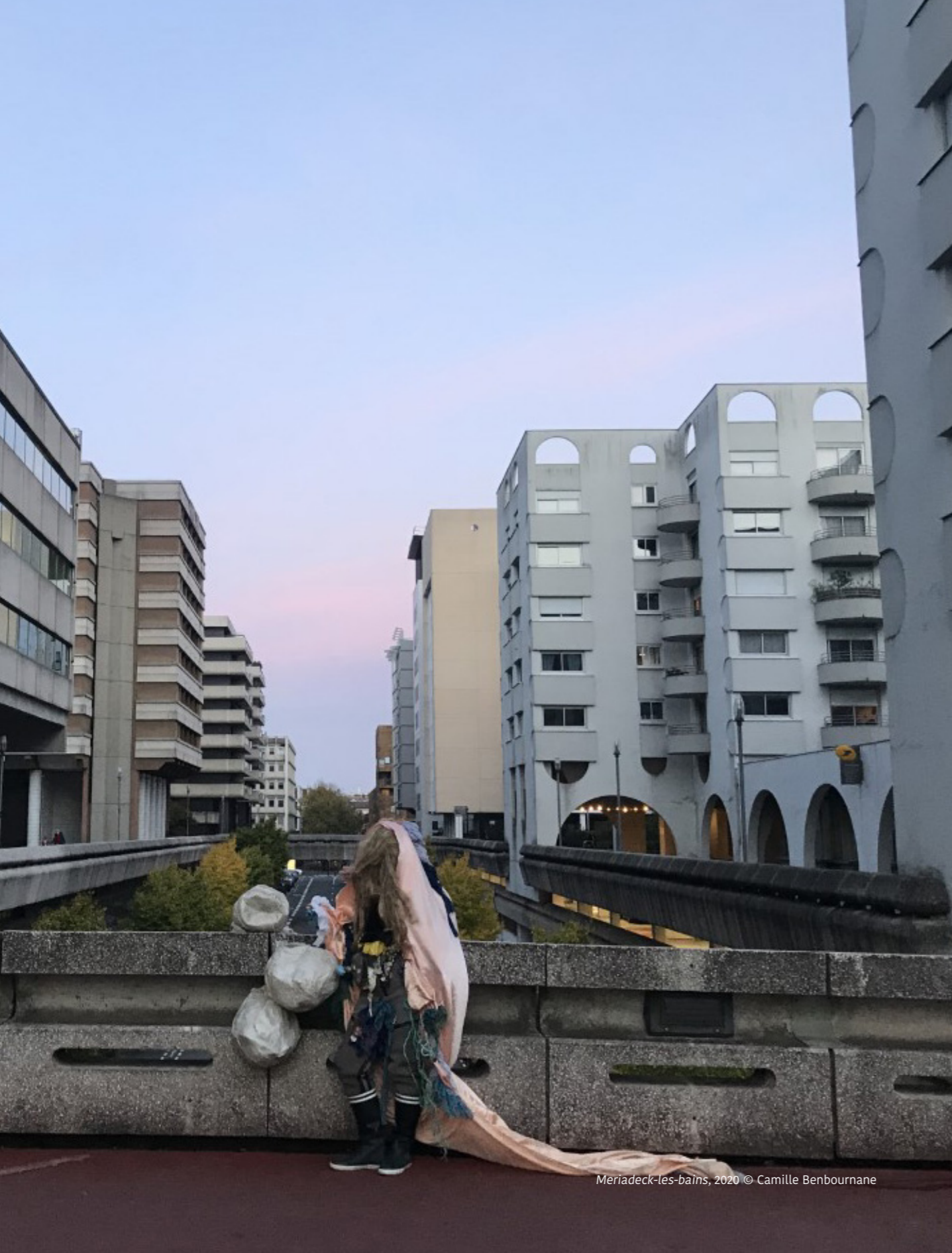
Meriadeck-les-bains, 2020