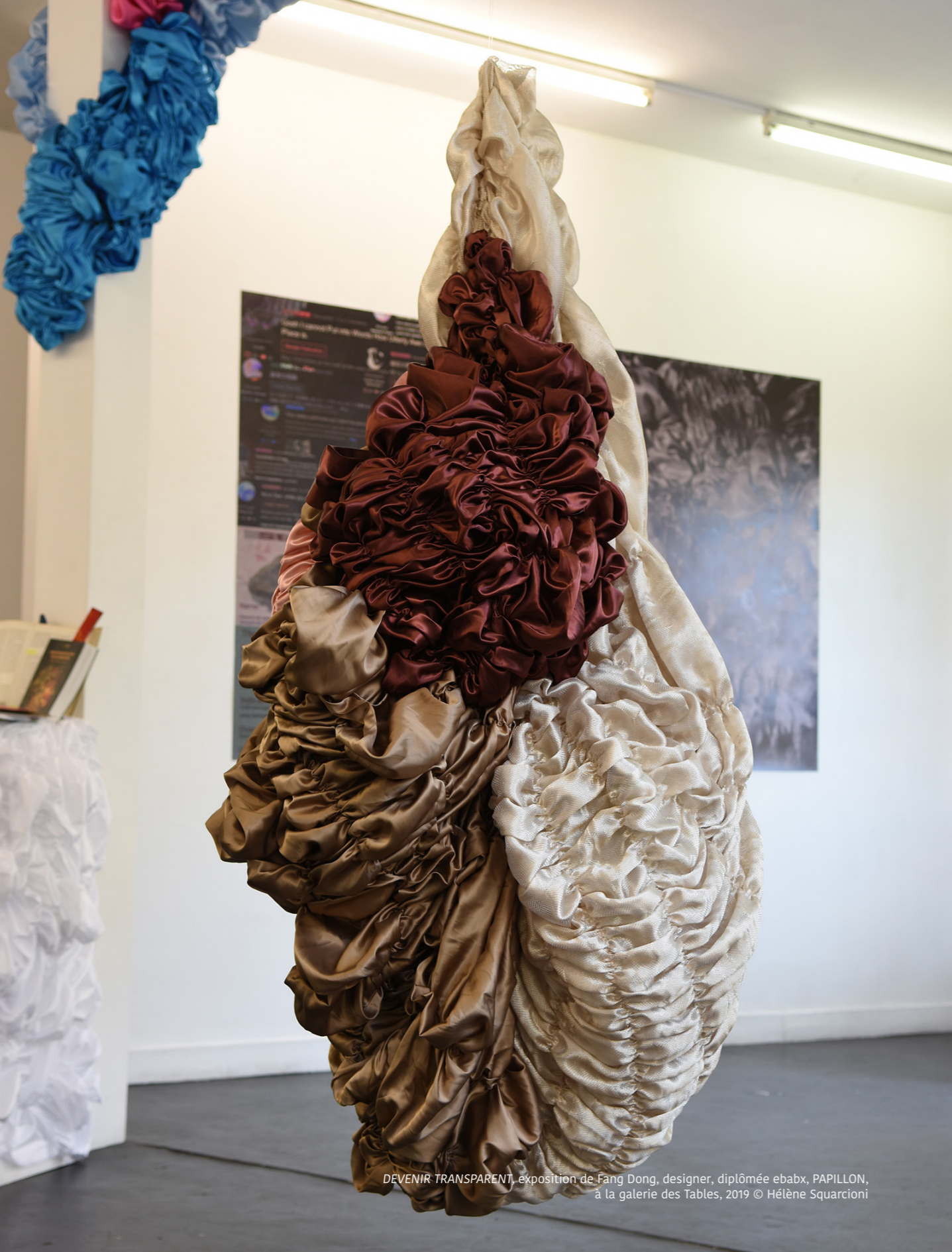
DEVENIR TRANSPARENT, exposition de Fang Dong, designer, diplômée ebabx, PAPILLON, à la galerie des Tables, 2019