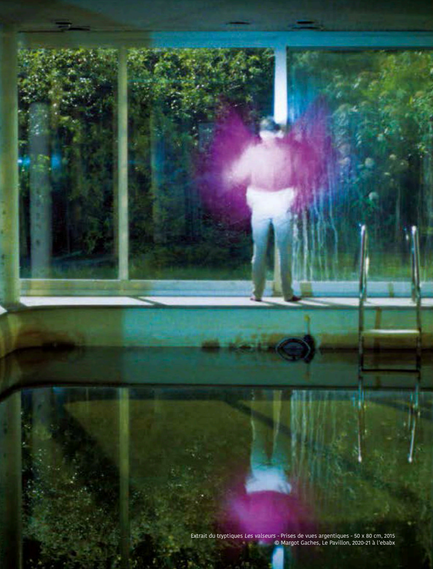
Extrait du tryptiques Les valseurs - Prises de vues argentiques - 50 x 80 cm, 2015 © Margot Gaches, Le Pavillon, 2020-21 à l'ebabx