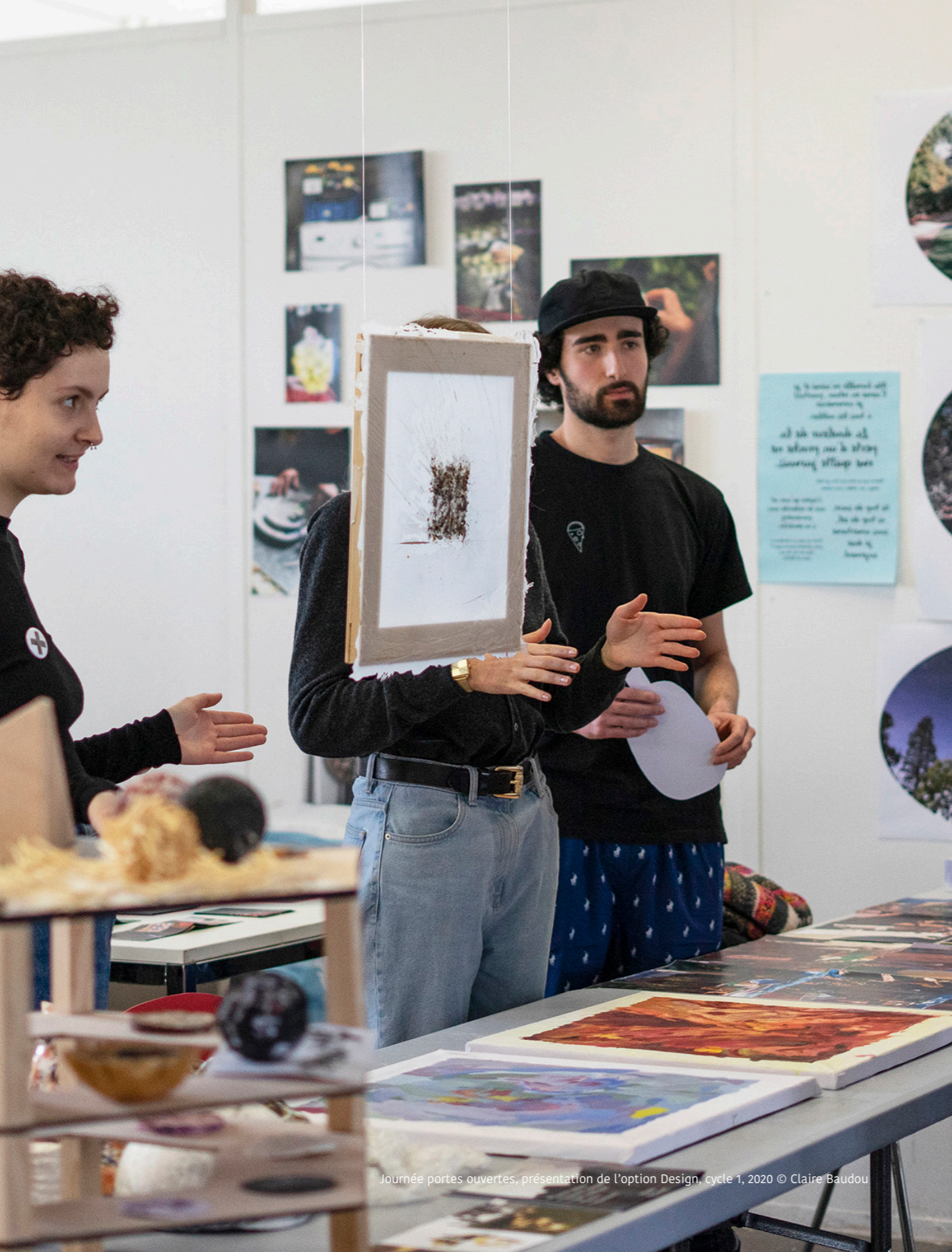
Journée portes ouvertes, présentation de l'option Design, cycle 1, 2020