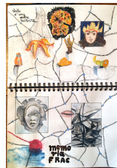
Exposition Hugo Pratt, lignes d'horizons Musée d'Aquitaine