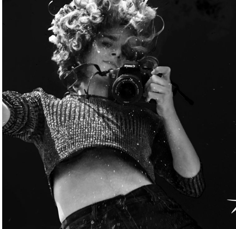
© Farah Fritz - photo autoportrait

En studio et hors les murs, rdv photo propose un cours ponctué par des temps de rencontre.s en extérieur, des temps de travail sur des projets photographiques personnels au studio photo et en salle des formations à l'ébax. Ouvert à tous les niveaux, du débutant à des profils plus expérimentés, rdv photo est avant tout une expérience photographie, une rencontre avec autrui, le contexte, le paysage, l'urbain, ... et une rencontre avec sa propre démarche artistique.