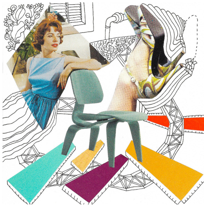
© Caracas, collage, 1950 - Andrea Posani

Chaque cours sera organisé autour de la découverte d'un.e artiste ou d'un mouvement relié au collage. Nous nous proposons d'étudier les différentes façons de fusionner des éléments par le collage, la peinture et le dessin, afin de déployer un éventail créatif plus large.