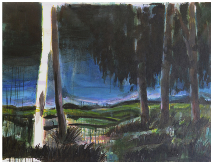
Une fissure dans la prairie