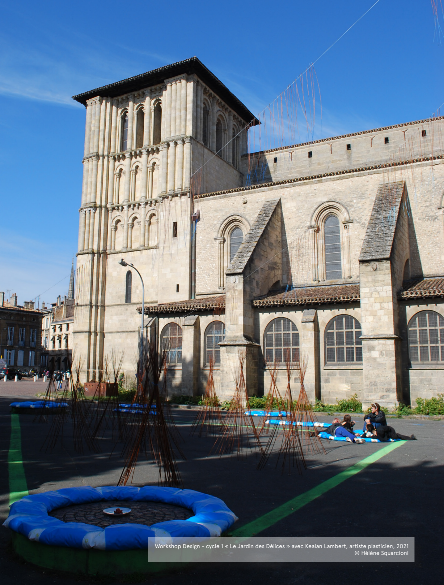
Workshop Design - cycle 1 « Le Jardin des Délices » avec Kealan Lambert, artiste plasticien, 2021