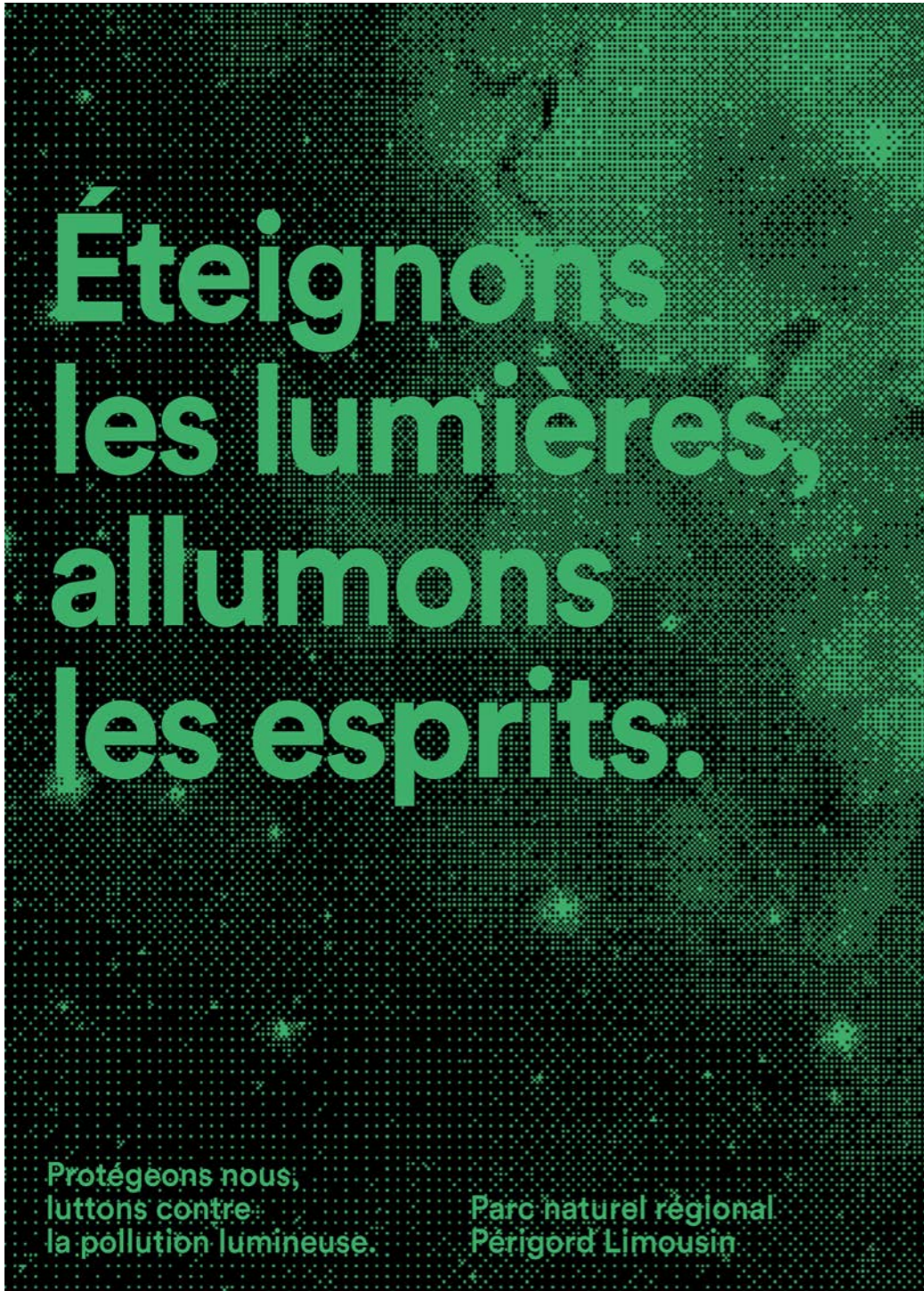
Affiche projet RICE Valentin Gioia, DNA option Design, cycle 1 © iso.ebax Depuis mars 2020, les étudiants des Parcours Design Zone51 et Design graphique Visions, cycle 1 de l'ebax observent l'environnement nocturne. Interventions en espace naturel et protégé et édition des projets, en lien avec le Parc Naturel Régional Périgord Limousin