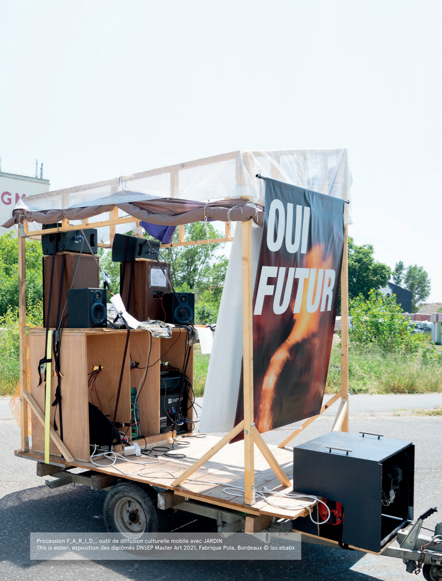
Procession F_A_R_I_D_., outil de diffusion culturelle mobile avec JARDIN This is water, exposition des diplômés DNSEP Master Art 2021, Fabrique Pola, Bordeaux