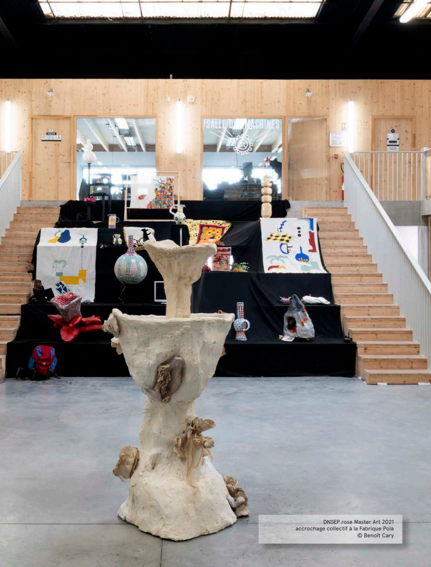
DNSEP rose Master Art 2021 accrochage collectif à la Fabrique Pola