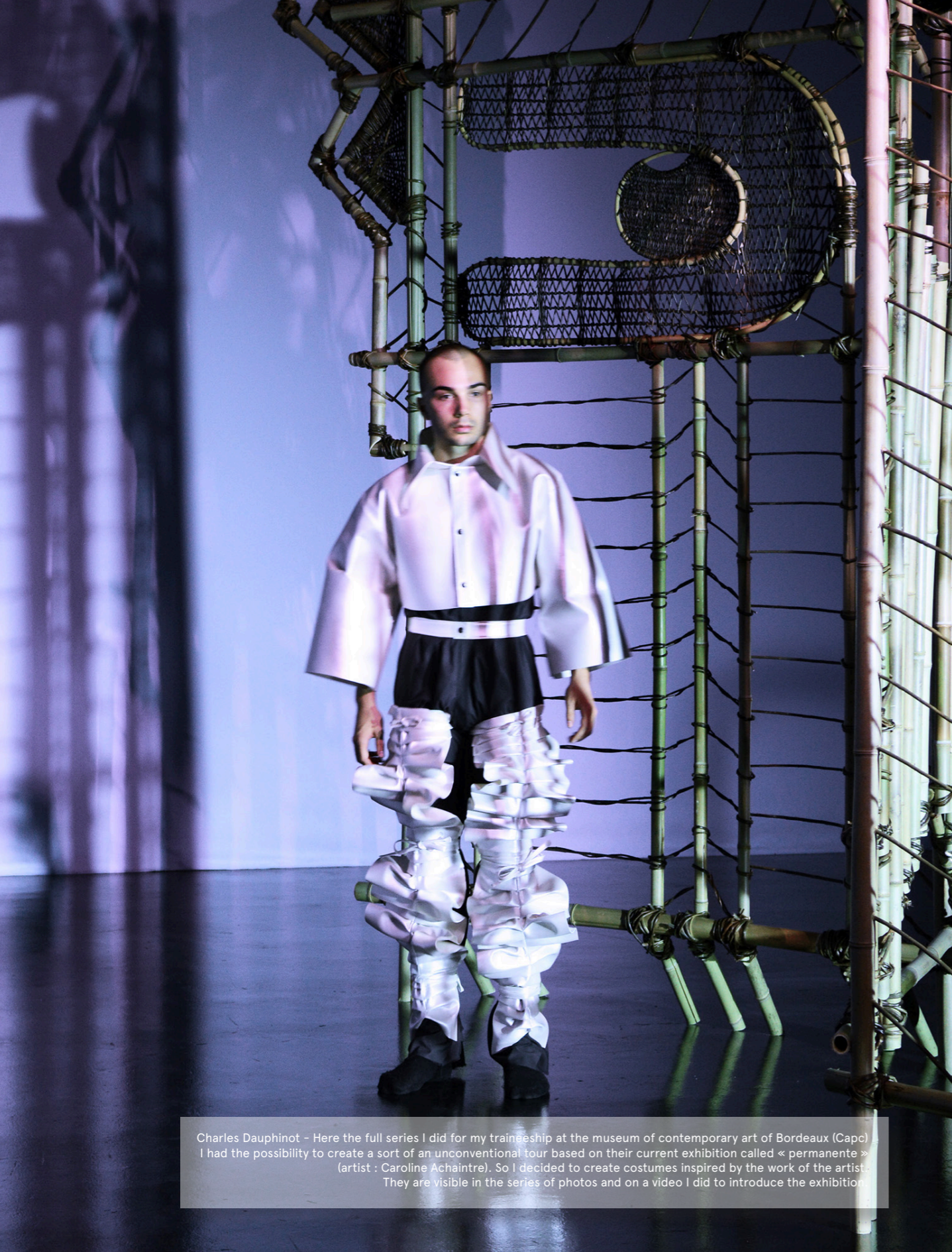
Charles Dauphinot - Here the full series I did for my traineeship at the museum of contemporary art of Bordeaux (Capc). I had the possibility to create a sort of an unconventional tour based on their current exhibition called « permanente » (artist : Caroline Achaintre). So I decided to create costumes inspired by the work of the artist. They are visible in the series of photos and on a video I did to introduce the exhibition.