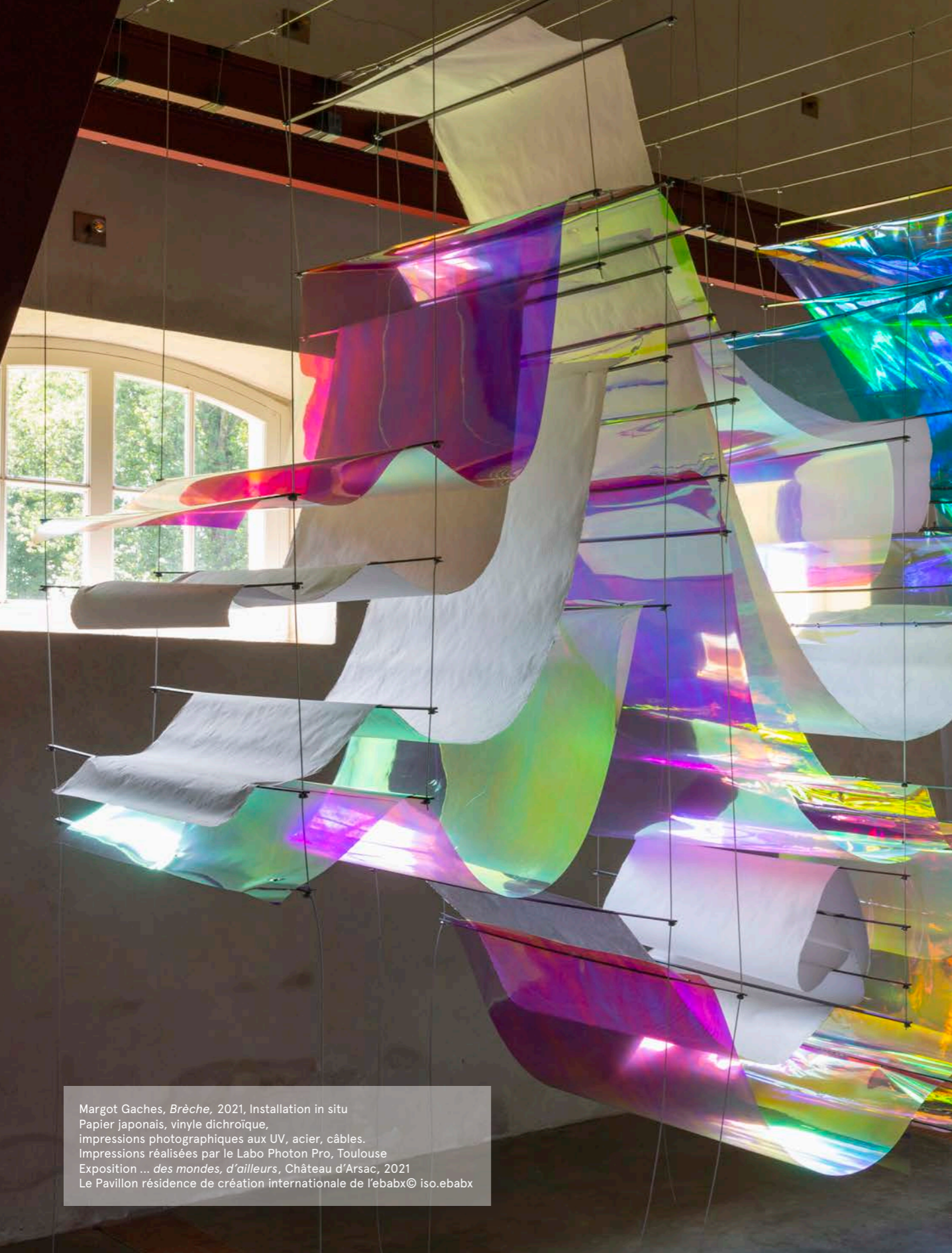
Margot Gaches, Brèche , 2021, Installation in situ Papier japonais, vinyle dichroïque, impressions photographiques aux UV, acier, câbles. Impressions réalisées par le Labo Photon Pro, Toulouse Exposition ... des mondes, d'ailleurs , Château d'Arsac, 2021 Le Pavillon résidence de création internationale de l'ebabx