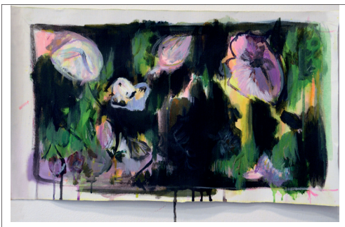
L'éclat des roses, 2021

Artiste vit et travaille à Bordeaux Diplômée DNSEP Art mention Design 2020 ebabx école supérieure des beaux-arts de Bordeaux solene.lestage@gmail.com Instagram : somanormori