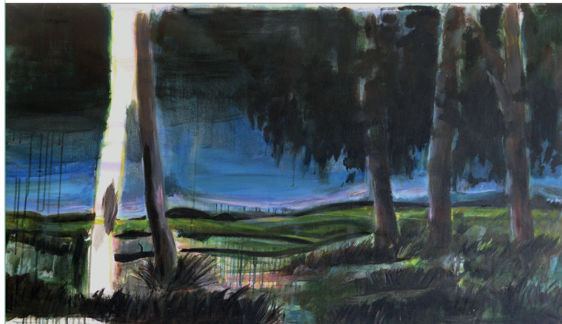
La fissure, 2021