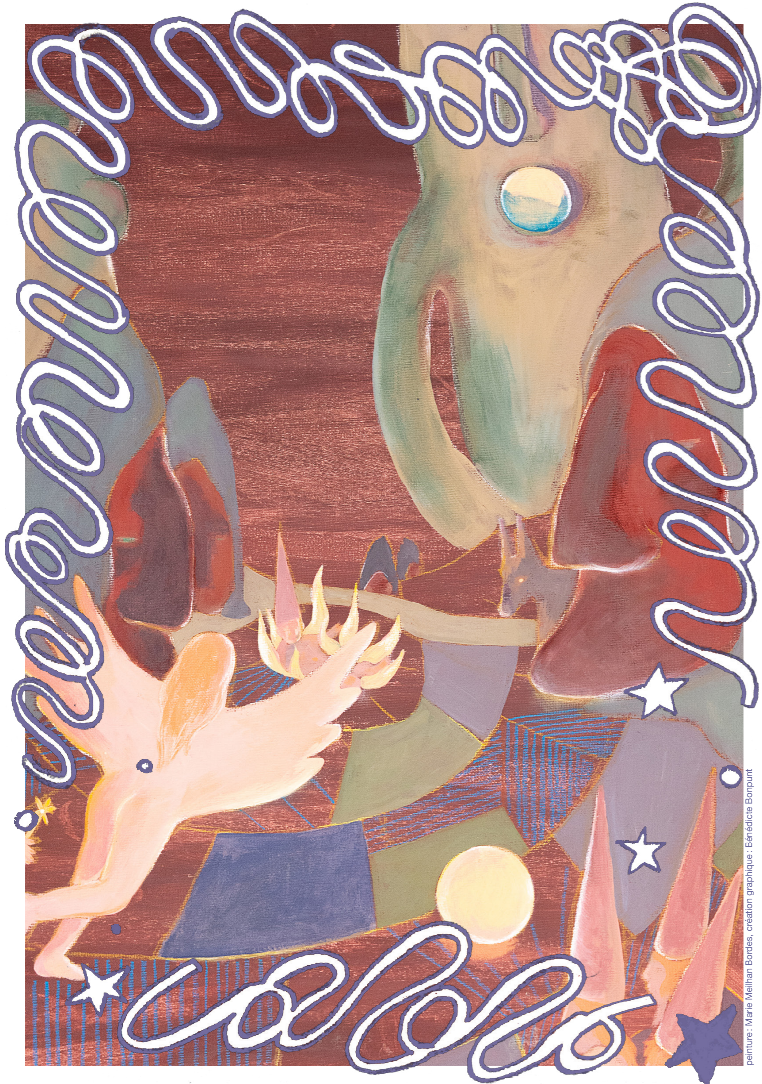
peinture : Marie Meilhan Bordeas, création graphique : Bénédicte Bonpurt